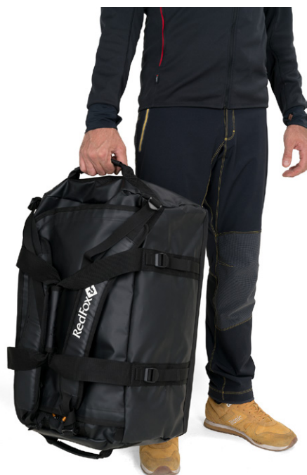
Переноска баула за торцевую ручку.