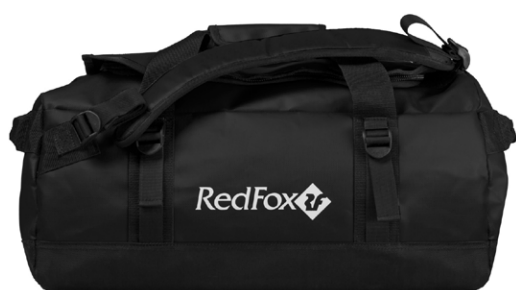
Duffel Bag 120