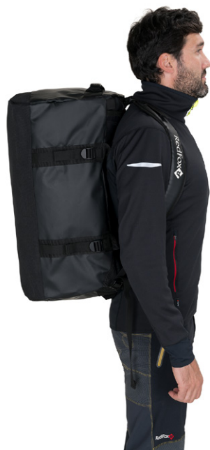
Можно переносить баул как рюкзак, на плечах.