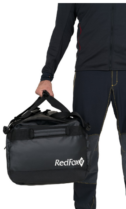
Переноска баула как сумки.