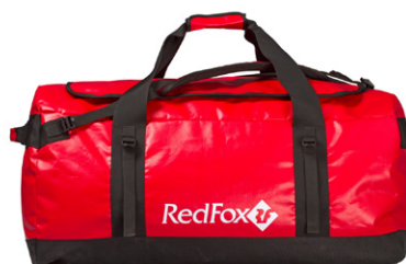
Duffel Bag 30

RU Надежные экспедиционные баулы для транспортировки вещей во время экспедиций и путешествий.