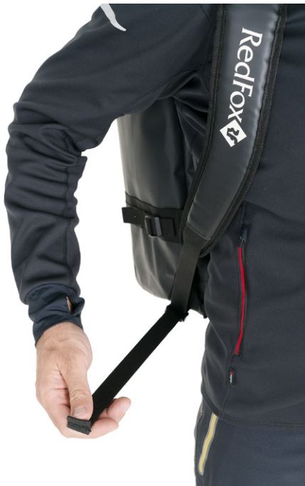
Можно равномерно распределить нагрузку на плечевые лямки.