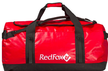
Duffel Bag 100