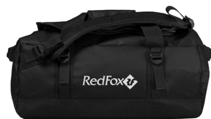
Duffel Bag 70