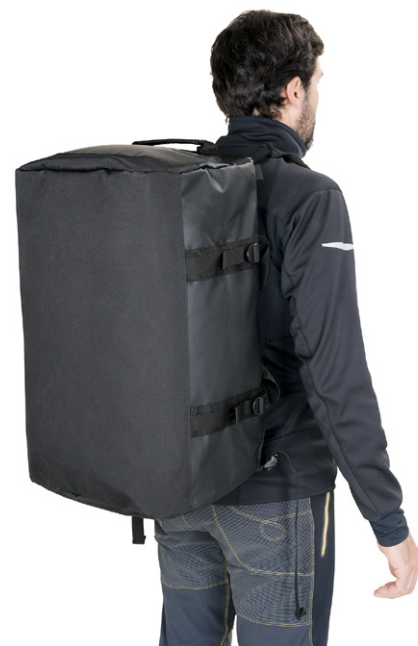
Правильно отрегулированный баул.